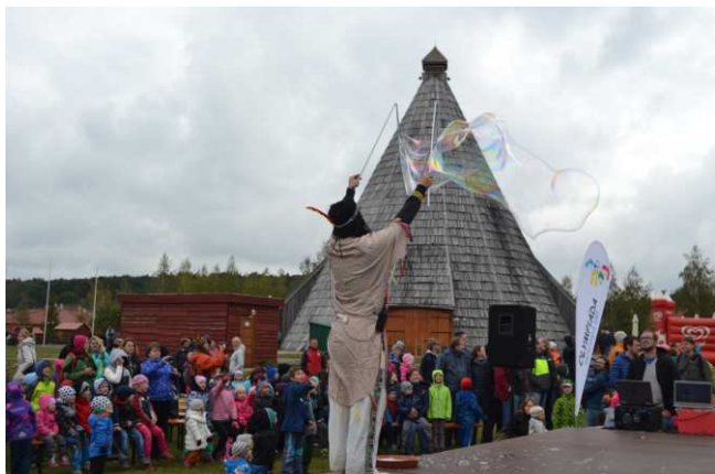
Putovní olympiády mateřských škol