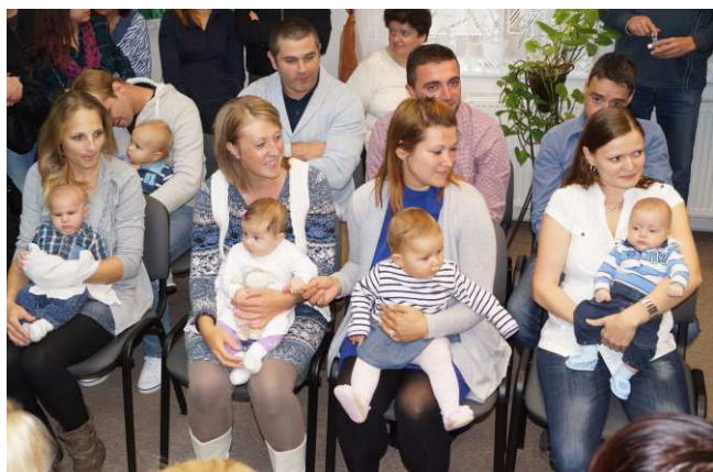
II. Vítání občánek