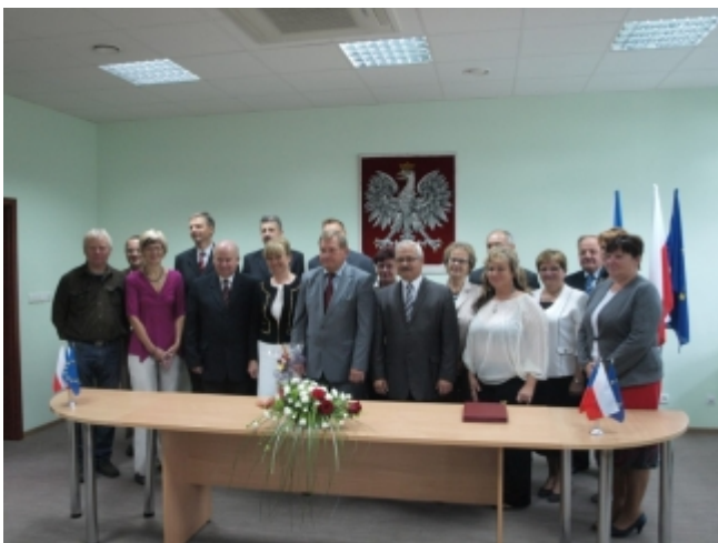
Slavnostní podpis smlouvy

Poslední srpnový víkend se „dámská“ část zastupitelstva v úle s naším starostou vydala do Polska. Po příjezdu do Popielowa jsme byli srdečně přivítáni. V sobotu dopoledne jsme v budově obecního úřadu slavnostně tuto smlouvu podepsali. Předmětem smlouvy je Všeobecná deklarace o přátelství v rámci sjednocování Evropy.