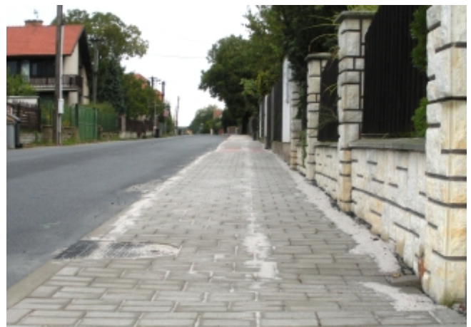
Nový chodník sm rem na Božec