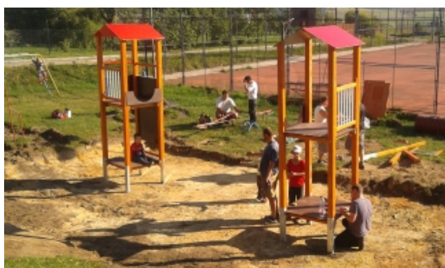
Rekonstrukce d tského h išt

Za átkem zá í byla zahájena rekonstrukce d tského h išt . D tské h išt je umíst no na starém fotbalovém h išti vedle víceú elového betonového kurtu. B hem rekonstrukce d tského h išt bude ást herních prvk nahrazena novými a zbývající budou opraveny. Rovn ž dojde k vyt žení cca 30 cm zeminy na d tském h išti. Zemina bude nahrazena ka írkem. Dále dojde k terénním úpravám v bezprost edním okolí d tského h išt . Rekonstrukce d tského h išt je provád na svépomocí. Pot ebnou techniku poskytla společnost Bohemia a. s. Zásnuky, která provádívýstavbu vodovodu a kanalizace v Božci. Rekonstrukce d tského h išt by nebyla možná bez sponzorského daru ve výši 100 000 K od společnosti AGRO Krakovany. Zbývající ást náklad vykrývá obec a sbor dobrovolných hasí .