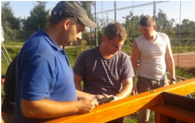
Rekonstrukce d tského h išt