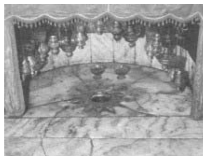
Betlém - Jeskyně Narození